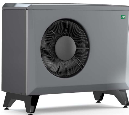
CTC EcoAir 406-420, 614M-622M