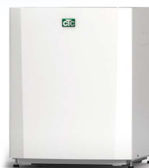
CTC EcoPart 406-412, 612M-616M