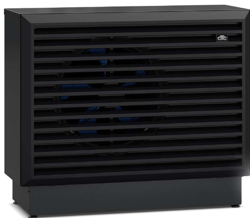
CTC EcoAir 700M

– for mere udførlige oplysninger henvises til de pågældende produktblade.