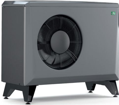
CTC EcoAir 406-408, 510M-622M

– lisätietoja on pumppujen tuote-esitteissä.