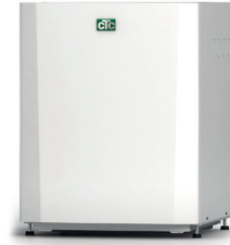
CTC EcoPart 406-412, 612M-616M