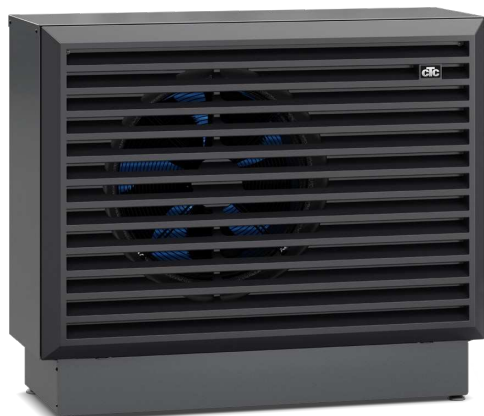
CTC EcoAir 700M

– för mer utförlig information se respektive produktblad.