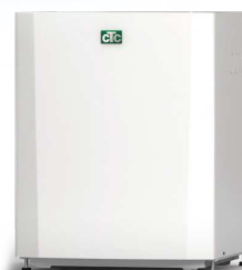
CTC EcoPart 406-412, 612M-616M