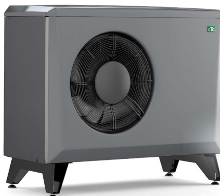
CTC EcoAir 406-408, 510M-622M