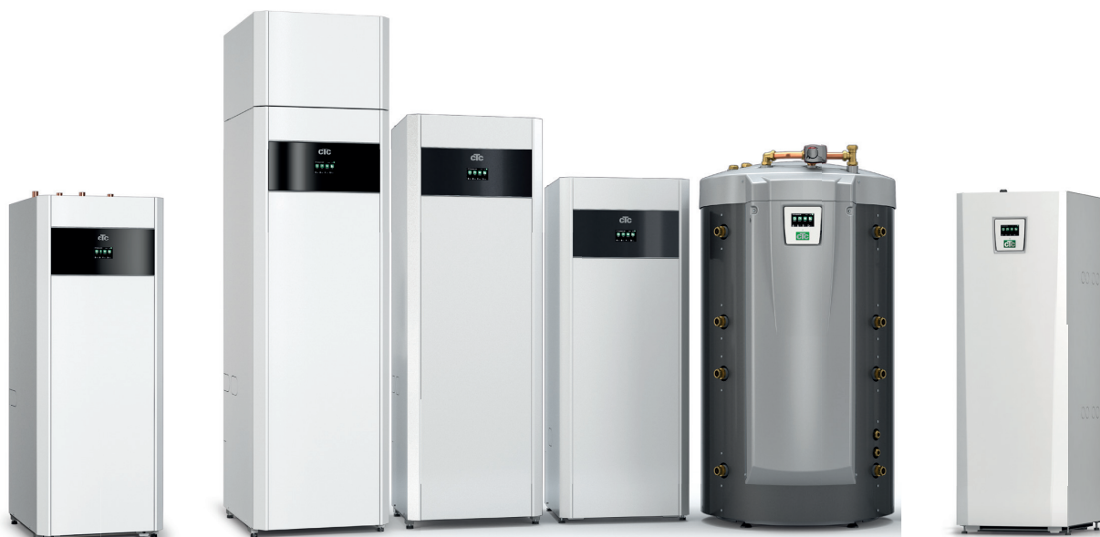
CTC EcoPart i600M

– se respektive produktark for mer informasjon.