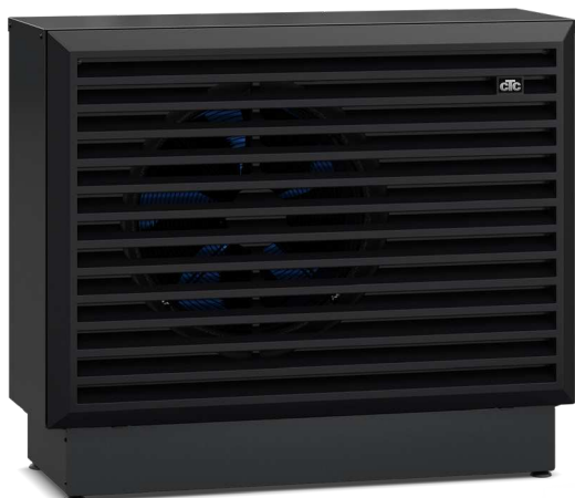
CTC EcoAir 700M

– för mer utförlig information se respektive produktblad.