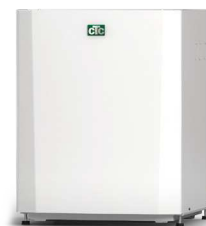
CTC EcoPart 406-412/600M