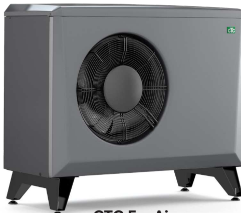
CTC EcoAir 406-408/600M