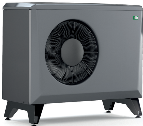
CTC EcoAir 406-408, 510M-622M

– se respektive produktark for mer informasjon.