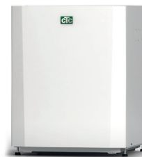
CTC EcoPart 406-412, 612M-616M