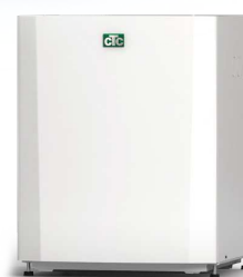
CTC EcoPart 406-412, 612M-616M